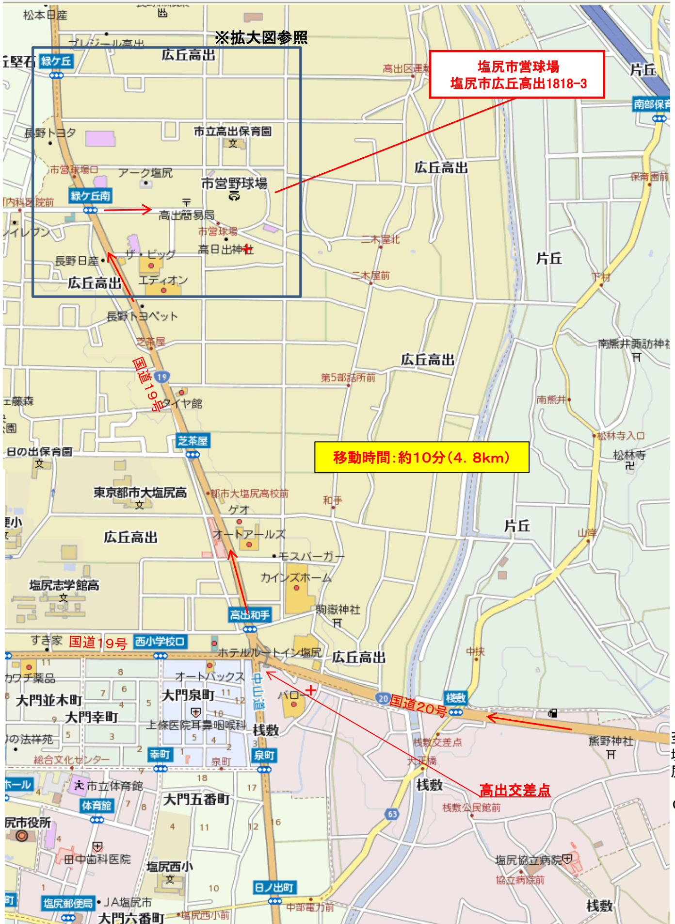
2018年度リトルリーグ信越連盟秋季大会(会場図 塩尻インター～塩尻市営球場)