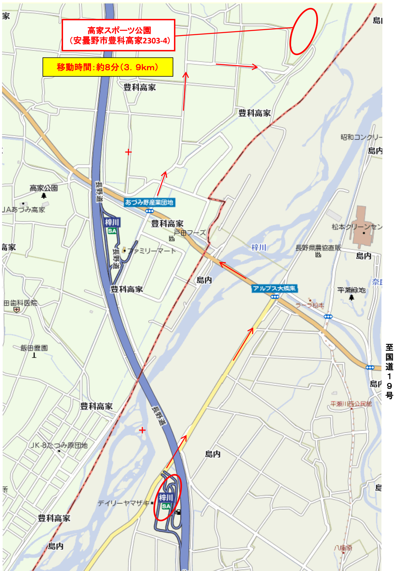
2018年度リトルリーグ信越連盟秋季大会(会場図 梓川SA~高家スポーツ公園)